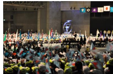
第10回全国障害者スポーツ大会 (千葉大会) 開会式 [幕張メッセ]

国体終了後に開催される全国障害者スポーツ大会について、施設整備、輸送交通、宿泊等の面で国体と深く関わるため、国体の開催準備と併せて効率的かつ円滑に準備を進めます。