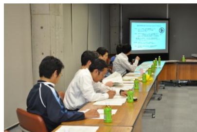
第1回出前講座の様子

広報紙の発行やマスメディアを通じた広報活動に加え、出前講座やパネル展示、各種イベントでのブース設置等を積極的かつ継続的に行い、福井国体に関する最新の情報等を広く県民に知っていただくとともに、開催気運の醸成を図ります。