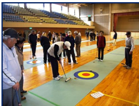
スティックリング